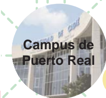
Campus de Puerto Real